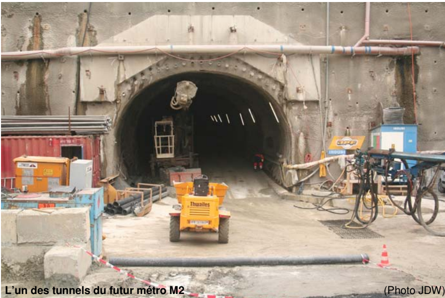
L'un des tunnels du futur métro M2