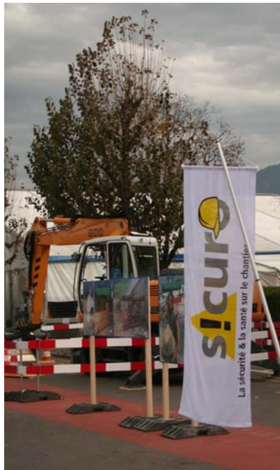
Concours machinistes

La journée du 31 fut l'occasion de présenter le nouveau parcours de sécurité destiné au personnel des chantiers. Donné dans son centre de formation de Kiemy à Düdingen, sous la conduite d'instructeurs qualifiés, ce cours forme les employés durant une demi-journée sur différents thèmes en relation avec la sécurité au travail. Le parcours 2005 sensibilisera le personnel sur les dangers liés à l'utilisation des machines à traiter le bois, les dangers de chutes. Un deuxième poste rappellera les règles à respecter pour l'élinguage des charges soulevées par les grues. Trois autres postes traiteront encore des dangers liés à la circulation routière, à la gestion des déchets