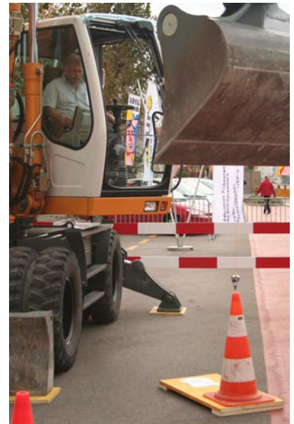
Machiniste à l'oeuvre

Für den Doktor Waldburger muss das Problem fachübergreifend angegangen werden, wenn man die Arbeitsunfähigkeit einschränken, einen Mitarbeiter rasch wieder integrieren und auf diese Weise die Kosten senken will.