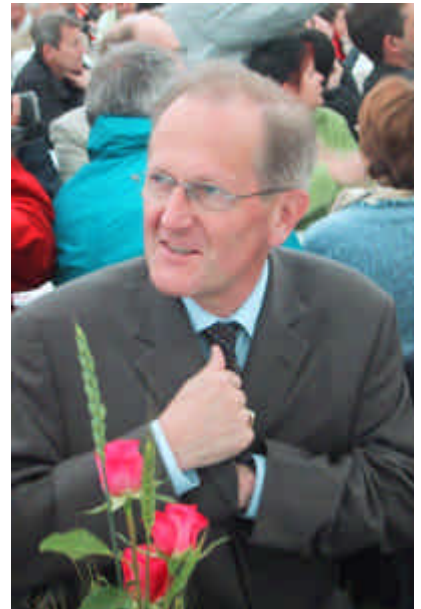
Joseph Deiss, notre Président de la Confédération, a adressé un vibrant appel aux entrepreneurs pour leur demander un effort pour la création de places d'apprentissage supplémentaires

Das neue Kursprogramm finden Sie ebenfalls auf unserer Internetseite www.ffe-fbv.ch/formation.htm