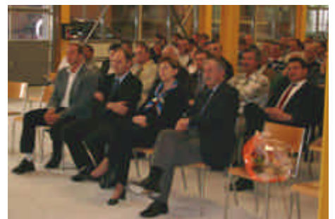
Halle des maçons le 14.05.04